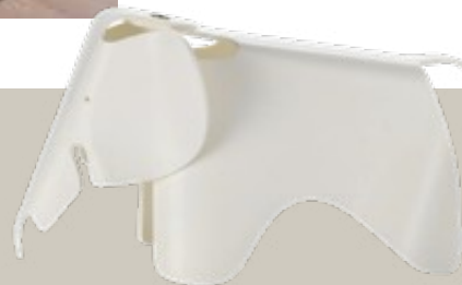
Zeitlos. Figur „Eames Elephant“ von Vitra um 285 Euro.