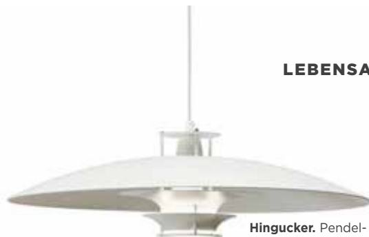
Hingucker. Pendel- leuchte von Artek, er- hältlich um 880 Euro.