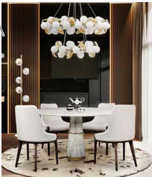
Exklusiv. Esszimmerstuhl „Moka“ von Caffè Latte Home, Preis auf Anfrage.