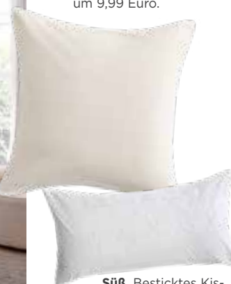
Süß. Besticktes Kissen um 19,99 Euro, gefunden bei H&M Home.