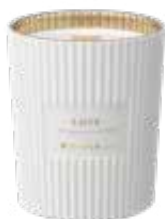
Harmonisch. Duftkerze „Love“ aus der Soulful Collection von Rituals um 44,90 Euro.