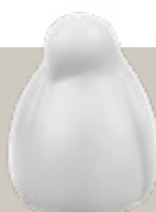
Klassisch. „Resting Bird“ um 89 Euro, erhältlich über vitra.com .