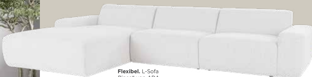
Flexibel. L-Sofa „Pinea“ von ADA, Preis auf Anfrage.