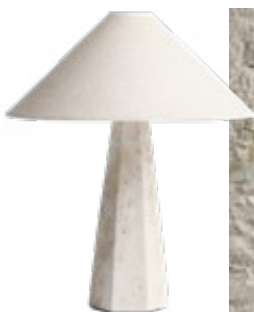
Stilvoll. Stehlampe von H&M Home um 149 Euro.