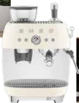
Funktional. Espres- somaschine von Smeg um 869 Euro, erhältlich bei XXXLutz.