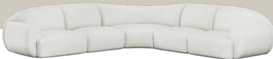
Eyecatcher. Modulares Sofa „Memoria“ von Natuzzi, Preis auf Anfrage.