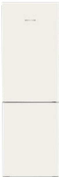
Hochwertig. Kühlschrank von Liebherr, Preis auf Anfrage.