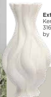
Extravagant. Keramikvase um 316 Euro von Casa by Josephine Jenno.