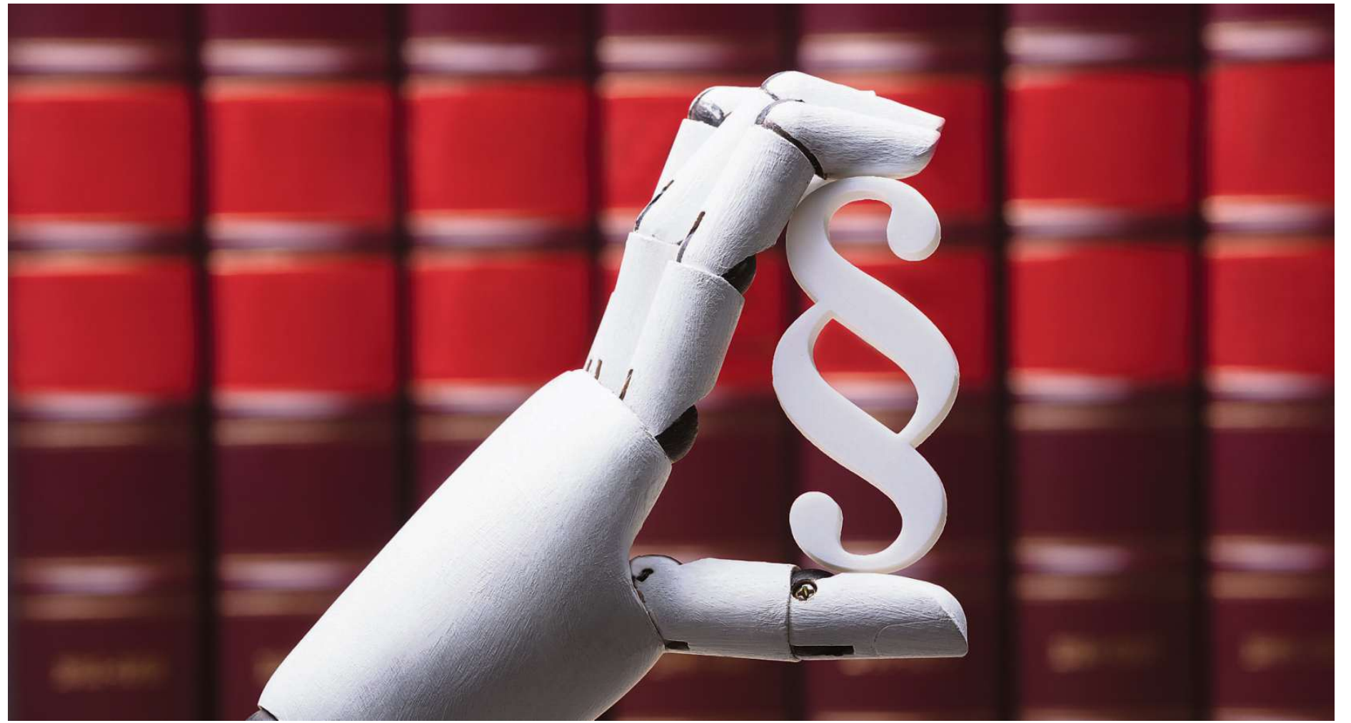
Legal Techs arbeiten mit Algorithmen und sammeln viele Fälle. Das senkt die Kosten. Verbraucher können über die Portale auch kleine Summen erstreiten.

nehmen meist als Inkassounternehmen registrieren. Denn sie arbeiten auf Erfolgshonorarbasis: Geld gibt es nur, wenn auch der Kunde etwas bekommt. Das trägt sich aber nicht mit der Tätigkeit als Anwalt. Denn Anwälte dürfen nur in Ausnahmefällen Erfolgshonorare vereinbaren. Im Normalfall gelten das Rechtsanwaltsvergütungsgesetz und die Bundesrechtsanwaltsordnung.