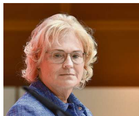
Prüft, ob Reformen nötig sind: Bundesjustizministerin Lambrecht.

Viele sind der Meinung, dass es solchen Handlungsbedarf gibt. Denn die Legal Techs bewegen sich derzeit in einer rechtlichen Grauzone. Das Rechtsdienstleistungsgesetz ist so gestrickt, dass es außergerichtliche Rechtsberatung nur in Ausnahmefällen erlaubt. Eine dieser Ausnahmen ist die anwaltliche Tätigkeit, eine andere Ausnahme sind Inkassounternehmen. Obwohl in vielen Legal Techs auch Anwälte sind, lassen sich die Unter-