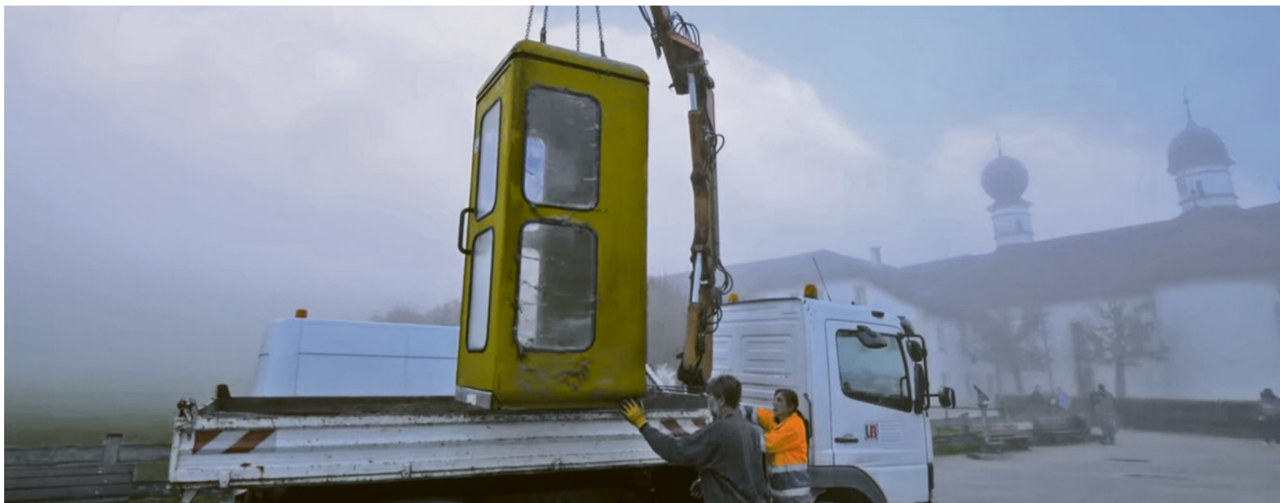
Abtransportiert: Am Königssee hat die Deutsche Telekom das letzte gelbe Telefonhäuschen abbauen lassen.