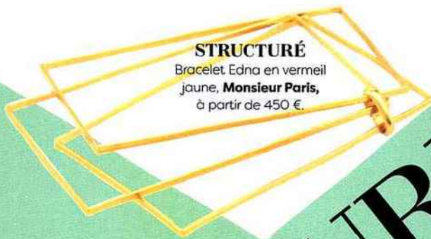
STRUCTURÉ Bracelet Edna en vermeil jaune, Monsieur Paris , à partir de 450 €.