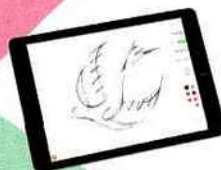
MÉMOY Bloc-notes numérique, ISKN, 179 €.