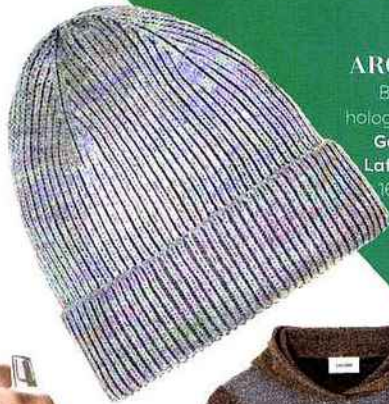
ARGENTÉ Bonnet holographique, Galeries Lafayette, 16,99 €.