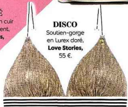
DISCO Soutien-gorge en Lurex doré, Love Stories, 55 €.