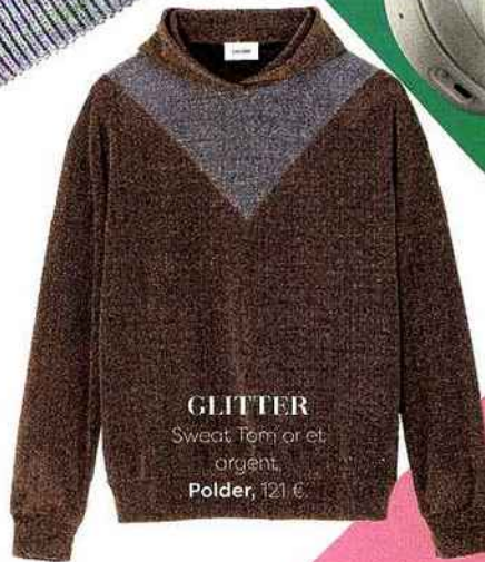
GLITTER Sweat, Tom et argente, Polder, 121 €.