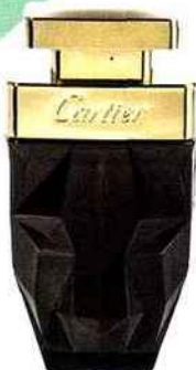
SAUVAGE Eau de parfum, Cartier , 68 € les 25 ml.