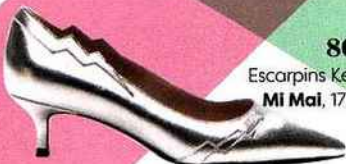
80'S Escarpins Keith, MI Mai, 179 €.