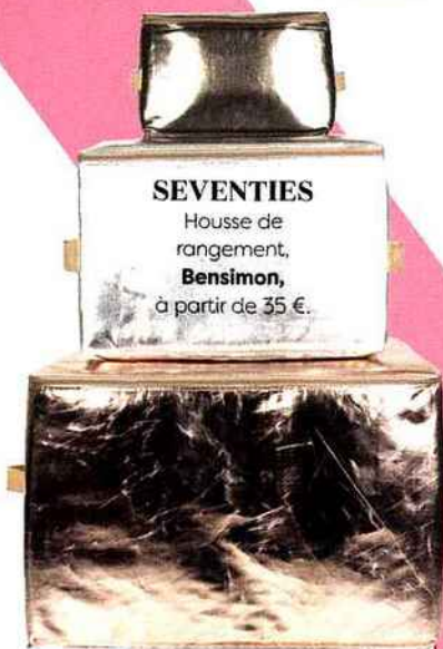
SEVENTIES Housse de rangement, Bensimon , à partir de 35 €.