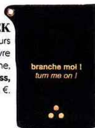
GEEK Batterie de secours universelle en chèvre noirci marine, Jérôme Dreyfuss , 155 €.