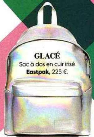
GLACÉ Sac à dos en cuir irisé Eastpak, 225 €.