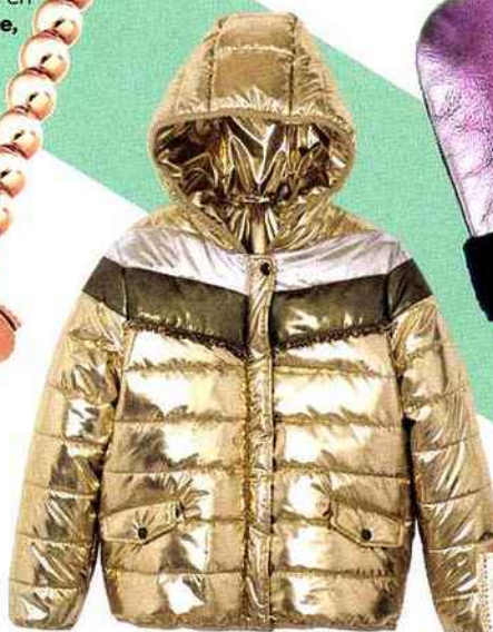
MATELASSÉE Doudoune dorée, Galleries Lafayette , 59,90 €.