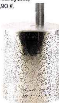
HIGH-TECH Enceinte Bluetooth rechargeable, design José Levy, Lexon , 99 €.