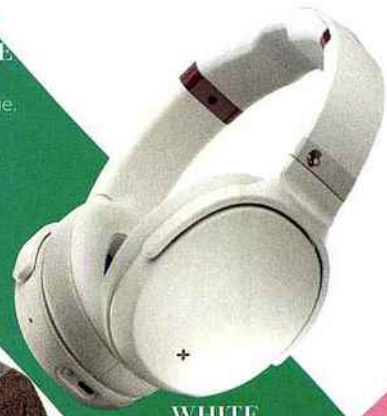
WHITE Casque Venue Vice: Skullcandy, 179,99 €.