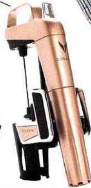
ASTUCIEUX Système de préservation de vin, Coravin, 299 €.