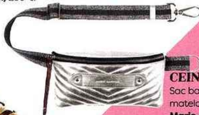
CEINTURÉ Sac banane en cuir matelassé argent, Marie Martens, 250 €.