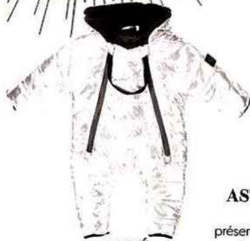
PARÉ Combipantalon en duvet, Finger in The Nose, 110 €.