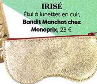
IRISÉ Étui à lunettes en cuir, Bandit Manchot chez Monoprix , 23 €.