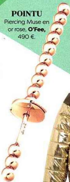
POINTU Piercing Muse en or rose, O'Fee , 490 €.