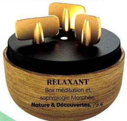
RELAXANT Box méditation et sophrologie Morphée, Nature & Découvertes, 79 €.