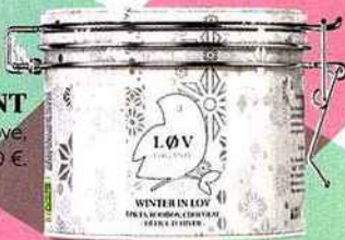
RÉCONFORTANT Thé Winter in Love, Lov Organic, 14,90 €.