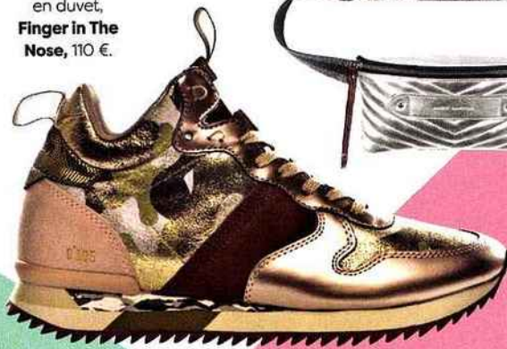
CLASSY Sneakers mi- montantes Street Trail Camo Copper, Zéro Cent Cinq, 224 €.