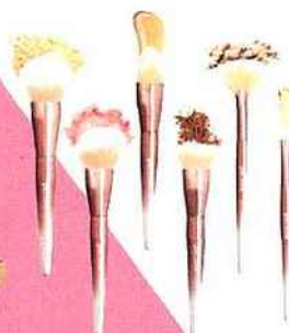
GIRLY Set pinceaux Dream Podium, Nocibe , 19,95 €.