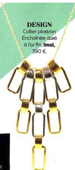
DESIGN Collier plastron Enchaînée doré à l'or fin, Imai , 390 €.